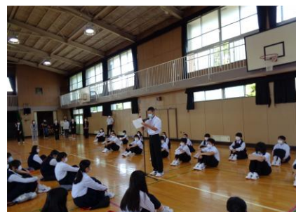
新入生代表のI君の 立派なあいさつ