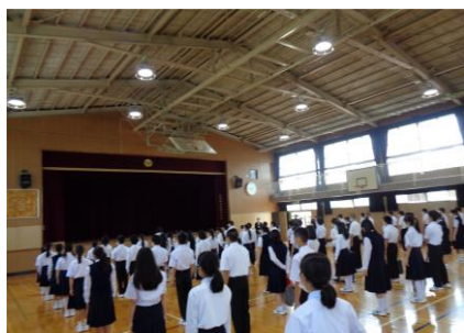
8時25分までに体育館に 全員集合!素晴らしい♪