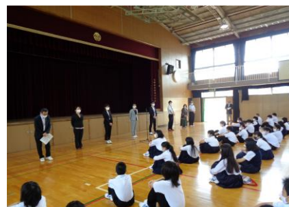
新しく来られた先生方の 紹介もありました