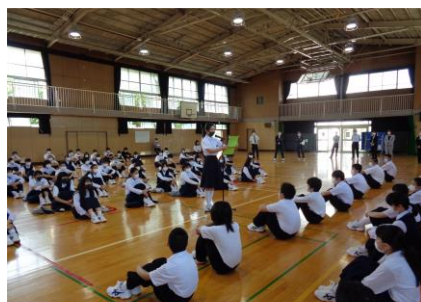
在校生代表のOさんの 新入生歓迎の言葉