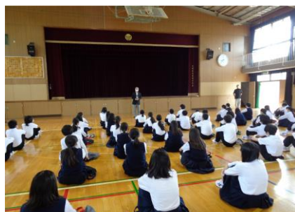
校長先生のお話から 今年度スタートです!