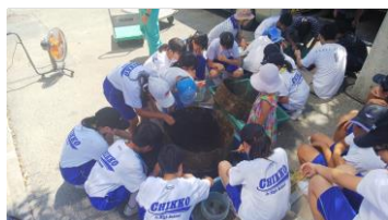
天保山の岸壁調査