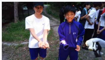
夜間の南港野鳥園