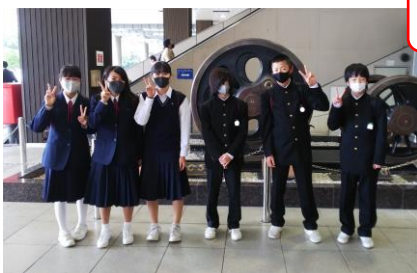
新大阪駅（修学旅行の集合場所）