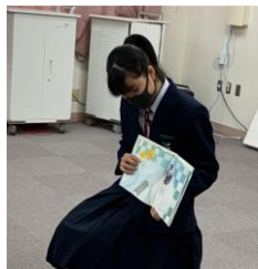
トイレせんちょう