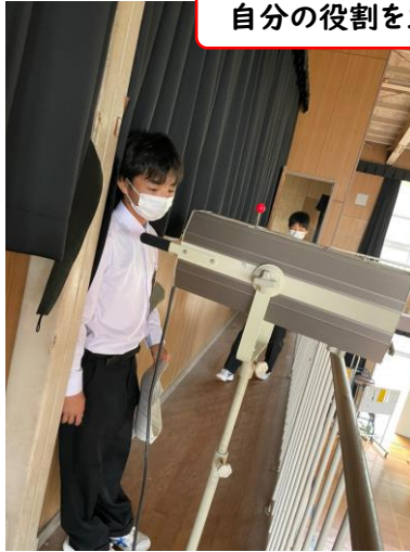
自分の役割を立派に果たします