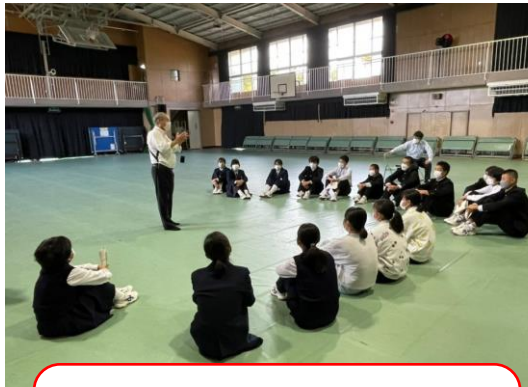
練習を見に来て下さった校長先生 (総監督) からアドバイスをいただき ました。ありがとうございます。