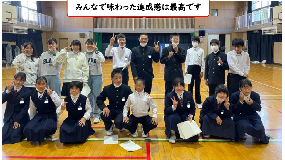
みんなで味わった達成感は最高です