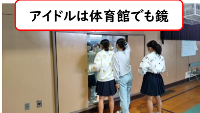
アイドルは体育館でも鏡