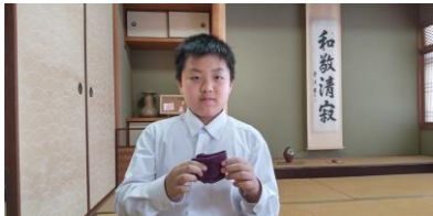
茶道部の“ふくさ”さばき