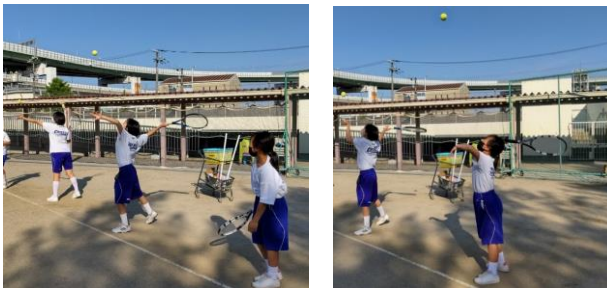
テニス部のサーブ 打点が高い！