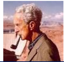
ノーマン・ロックウェル (1894~1978 アメリカ)