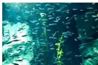
アリューシャン列島