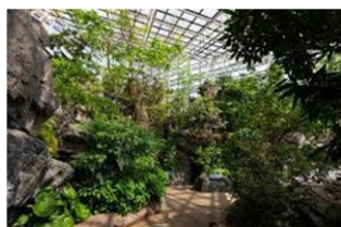
日本の森（カワウソ）