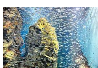
チリの岩礁地帯（イワシ）