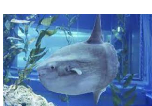
特設水槽（マンボウ）