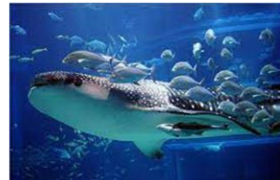
太平洋（ジンベエザメ）