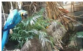
エクアドル熱帯雨林