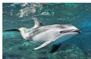
タスマン海（イルカ）