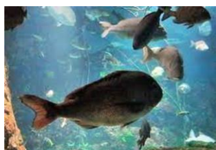
瀬戸内海（イシダイ）