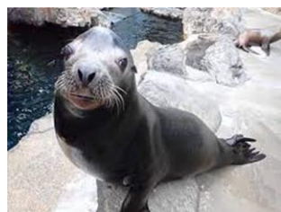
モンタレー湾（アシカ）