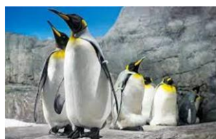
南極大陸（ペンギン）