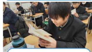
三島由紀夫 不道德教育講座