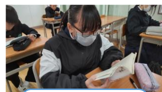
チョコレート 工場の秘密