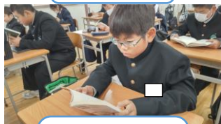
恐怖の館へ ようこそ