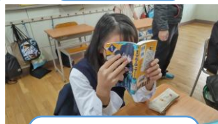
ブルーロック (小説版)