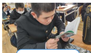
高校野球 弱者の戦法