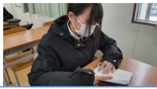
隠された意味に気がつけるか？ 3分間ミステリー 真実はそこにある