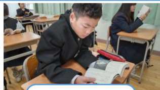
ワンピース (小説版)