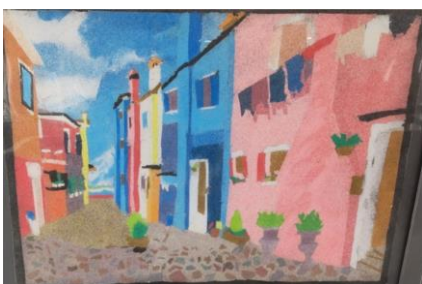
ボ・カープの町なみ