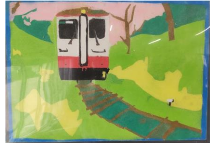
桜のトンネルを進む