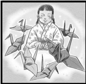
[英語劇：The Story of Sadako]

いよいよ今日は文化祭！ 文化部の人にとっては、日頃の活動を全校生徒や保護者の方々に見ていただく良い機会です。ぜひとも発表を成功させてもらいたいですね～！特に、舞台発表は特に一発勝負ですから緊張すると思いますが精一杯がんばってほしいです。