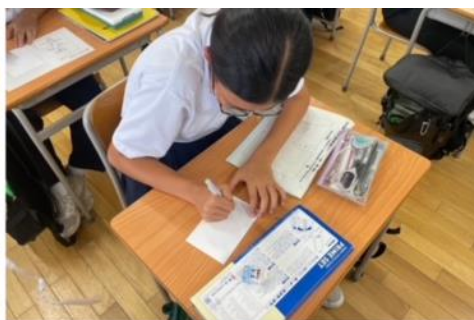
3日(火)テストの様子(上)と テスト後の避難訓練の様子(下)。