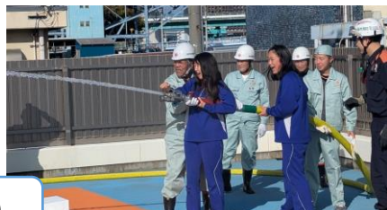
地域防災リーダー（築港中 39 期生）