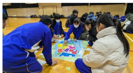
図上訓練（防災すごろく）