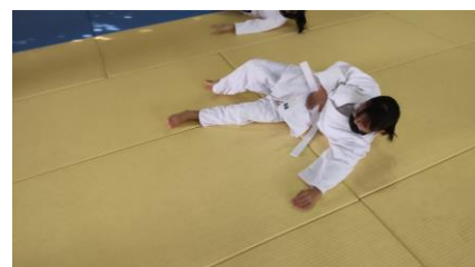
前回り受け身の写真です。