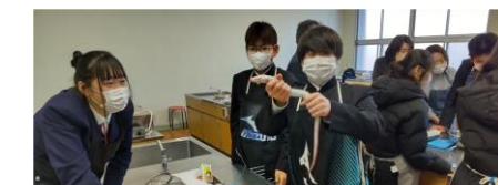
あなごを素手でつかめる人たち