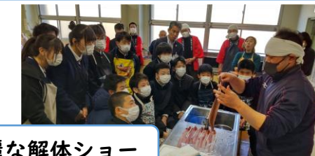
華麗な解体ショー