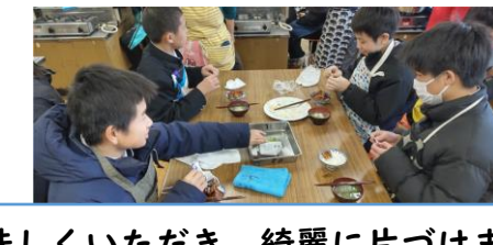
美味しくいただき、綺麗に片づけました