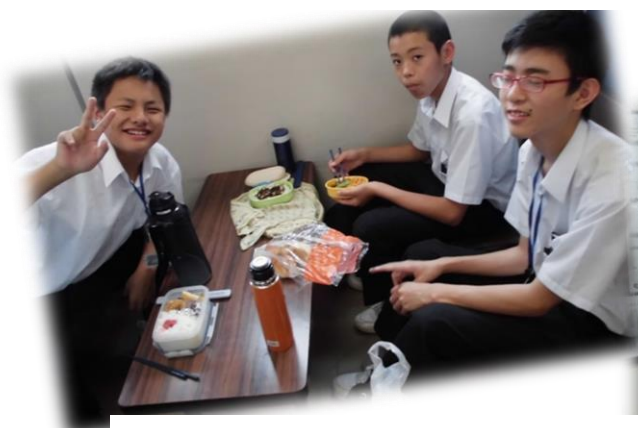
築港保育園 中学生チームで 玉入れ