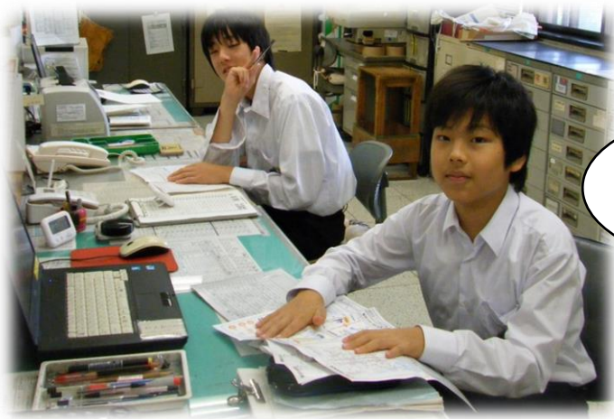
港図書館 本の整理の合間。