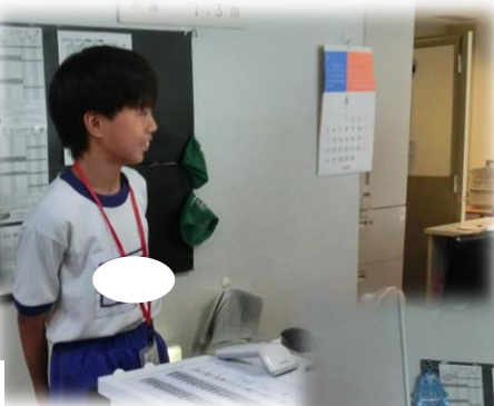
大阪プール 受付係