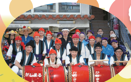
関西沖縄の集いが集まるの会