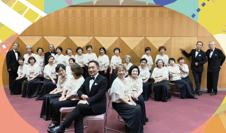
大正区民合唱団「大正フロイデ」