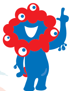
大阪・関西万博公式キャラクター ミヤクミヤク