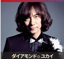
ダイヤモンド☆ユカイ