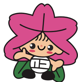
大正区イメージキャラクター ツージ