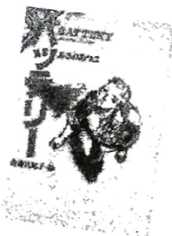
『バッテリー』 あさのあつこ/著

中学入学を前に岡山県に 引っ越してきた巧。そこ で、豪と出逢いバッテリー を組むことに。誇り高 きピッチャーと心通わせ ようとするキャッチャー。 大人をも動かす少年 たちの物語。