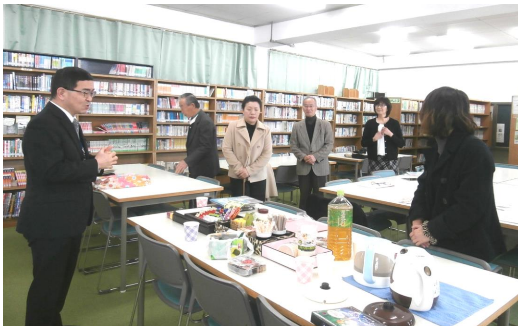
校長先生より、日頃の活動への感謝と引き続いてのご協力をお願いしました。

十三中学校では毎月第2木曜日（学校行事により変更あり）に「朝の読み聞かせ」をおこなっています。3月10日の読み聞かせ終了後は図書室にてボランティアさんとの意見交換会をおこないました。読み聞かせを通して感じた事や、作品の選び方など、色々なご意見を聞かせていただきました。この朝の10分間のために作品を選び、練習をし、お仕事やお家の事など色々な都合をつけて時間を作ってくださるボランティアの皆さんに感謝しております。ありがとうございます。