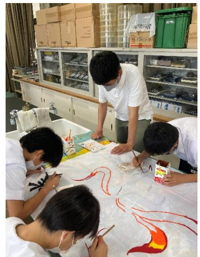
裏面に学級旗の写真