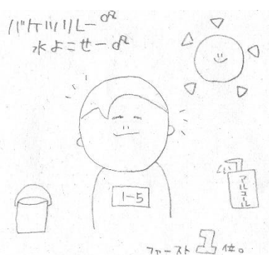
（イラスト 5 組 女子）

★中学校初の体育大会が始まり、不安や緊張でいっぱいでした。ぼくは美化委員なのでいろいろな仕事があり、とても大変なのでうまくできるか、失敗して他人に迷惑をかけないかなど、さらに不安になって開会式が始まりました。暑い中で話を聞きながら姿勢をよくしているのはとても辛かったです。ですがなんとか耐えられて、ラジオ体操も先生に言われたことを意識してできました。美化委員の仕事は大変で、ハードルの高さを調節するときにとっても手こずってしまいました。ですが委員会の先輩に助けていただいたので何とかやりきることができました。バケツリレーやリレーも負けてしまったけれど、一生懸命にやり遂げられたので良かったと思いました。結果は負けてしまったけれど、楽しかったので良かったです。