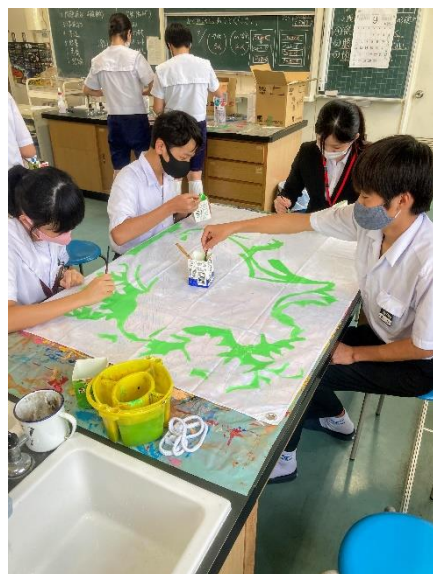
学級旗づくりに参加してくれたみなさん お疲れさまでした。ありがとう！