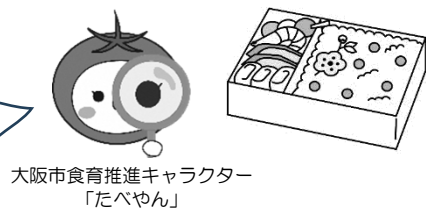
大阪市食育推進キャラクター「たべやん」