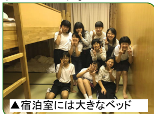
▲宿泊室には大きなベッド