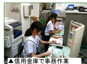
▲信用金庫で事務作業