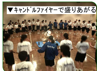
▼キャン「ル」ファイヤーで盛りあがる