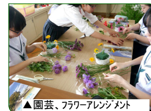
▲園芸、フラワーアレンジメント