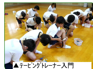
▲テビングドレナー入門