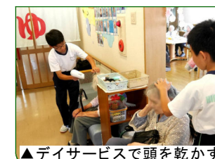
▲デイサービスで頭を乾かす