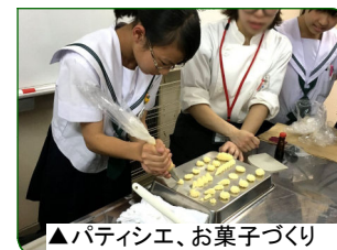
▲パティシエ、お菓子づくり