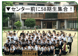
▼センター前に58期生集合！

5月31日(木)～6月1日(金)、1年生は吹田市自然体験交流センター「わくわくの郷」で一泊移住を行いました。一泊移住では、自然の中で宿泊しながら、中学校で新しく出会った仲間たちと様々な活動をしながら交流します。これからの3年間を一緒に歩む58期生の絆を深め、互いに成長しあう仲間づくりを行うものです。