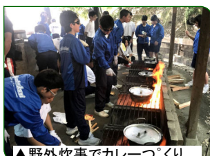
▲野外炊事でカレーづくり

2日間の集団行動を通じて、仲間と協調して共に活動しました。班長や実行委員が中心となって、皆がそれぞれの役割をしっかりと果たし、自主的で自律した集団活動を行うことができました。活動の中では各リーダーがしっかりと声を出して皆をまとめて活躍し成果のあるよい宿泊行事となりました。皆で楽しむことができた一泊移住でした。