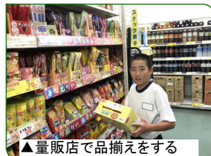
▲量販店で品揃えをする