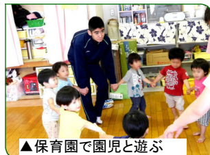
▲保育園で園児と遊ぶ

事業所へ訪問し挨拶したりしてきました。学校外へ出て、社会のルールやマナーを体得するよい経験になると思います。そして、将来の進路や夢を考える機会になったのではないかと思います。仕事を通して自分を磨き、忍耐強くやり抜く力を身につけ信頼される人になってほしいです。東三国中学生として、職業体験の経験を活かして、「元気なあいさつ」「明るい笑顔」「前向きな気持ちと態度」で、これからの中学校生活も頑張りたいと思います。