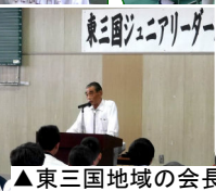
▲東三国地域の会長