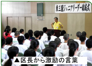
▲区長から激励の言葉