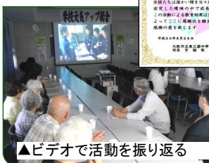
▲ビデオで活動を振り返る