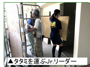
▲タタミを運ぶJr.リーダー

7月1日(日)、新東三国地域のマンションで、大阪北部地震の影響で各室タンクの水もれでタタミが使えなくなっていました。そのタタミを搬出すべく、ジュニアリーダーへの要請があり、25名の生徒が参加してくれました。町会長さんからも感謝のお言葉をいただきました。