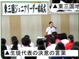
▲生徒代表の決意の言葉