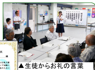
▲生徒からお礼の言葉