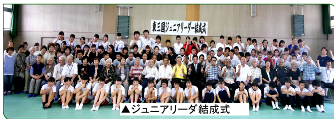
▲ジュニアリーダー結成式