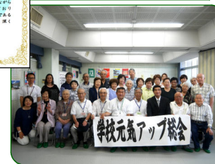
▲学校元気アップ総会