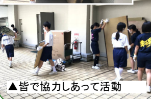
▲皆で協力しあって活動

生徒たちが地域のために活動し活躍してくれていることを本当にうれしく思います。自分たちの地元を自分たちで守っていく。地域の方々からたよりされるジュニアリーダーの活動を誇りに感じます。