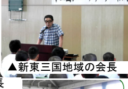
▲新東三国地域の会長