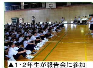
▲1・2年生が報告会に参加