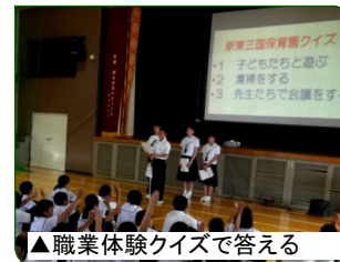
▲職業体験クイズで答える