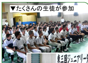
▼たくさんの生徒が参加