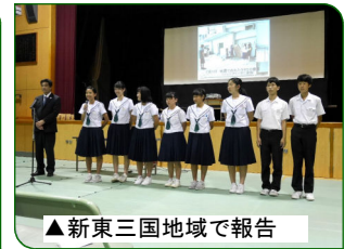
▲新東三国地域で報告