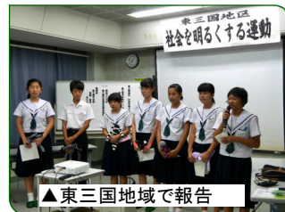
▲東三国地域で報告

最初に編集したビデオをみていただき、東北研修で体験したことを生徒たちが発表しました。