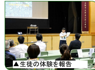
▲生徒の体験を報告

この報告会を通じて、東三国校区の防災・減災への意識が高まり、ジュニアリーダーたちがさらに成長してくれることを願っています。