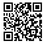
▲PTAメールの登録QRコード

今後は、その時の状況をしっかり把握し判断し、迅速な情報提供と、生徒たちの安全の確保に全力を尽くしていく所存です。そのためにも、PTAのメール配信サービスへの登録が、まだのご家庭には、ぜひご登録をしていただきますよう再度お願い申し上げます。