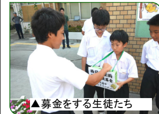
▲募金をする生徒たち

7月17日・18日、ジュニアリーダーたちの呼びかけで、西日本豪雨災害への募金活動を行ってくれました。社会的なことにも目を向けて、自分たちにできることを考えての行動です。ジュニアリーダーたちは、ひとつひとつの活動を通して、