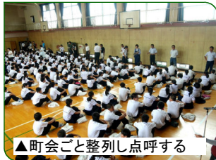
▲町会ごとと整列し点呼する

7月4日の避難訓練は、雨天のため体育館で町会ごとの整列を練習しました。初めての整列でしたがスムーズに行うことができました。