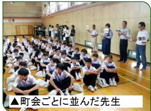
▲町会ごとに並んだ先生