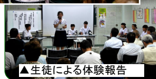
▲生徒による体験報告