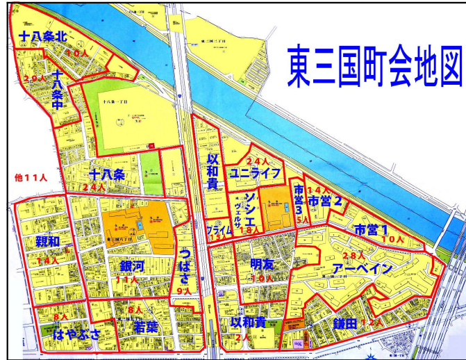
▲東三国中校区の防災避難区割り地図

9月1日(土)には、土曜授業で防災訓練を行う予定です。ご協力のほどお願いいたします。