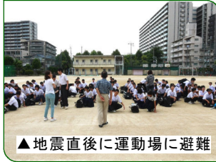
▲地震直後に運動場に避難

6月18日に発生した大阪北部地震では、いろいろなことを考えさせられました。午前7時58分、登校途中に発生したので、一人でいた生徒もいて、生徒たちの不安も大きかったようです。