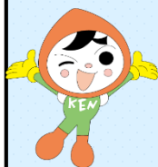
人権イメージキャラクター 人KENまる君