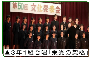
▲3年1組合唱「栄光の架橋」