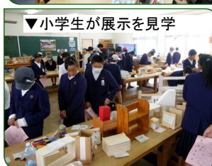
▼小学生が展示を見学