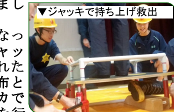
▼ジャッキで持ち上げ救出

最後に、東三国中のジュニアリーダたちが、3月に東北ボランティア研修に参加した様子を、地域の方や小学生の前で、DVDを見てもらい、感想文を読み上げて報告しました。