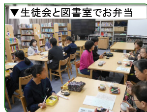
▼生徒会と図書室でお弁当

東三国中学校では、日頃から元気アップボランティアさんとの交流や、ジュニアリーダとしてボランティア活動に参加し、地域の一員として活躍し、安心して学校生活をし、学習に、運動に、文化活動に熱心に取り組む生徒を育成しています。