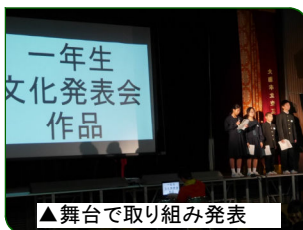
▲舞台上で取り組み発表