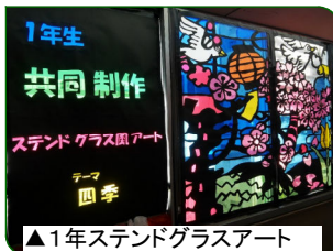
▲1年ステンドグラスアート