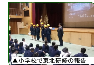
▲小学校で東北研修の報告

とても有意義な防災訓練となり、それぞれの意識も高まったと思います。今後も地域と共に防災や減災について、何ができるのかを考えていきたいと思っています。