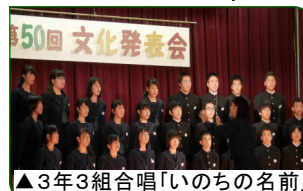
▲3年3組合唱「いのちの名前」