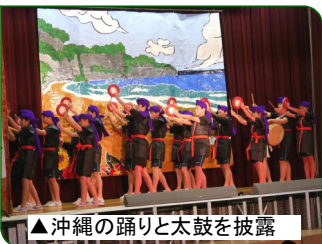
▲沖縄の踊りと太鼓を披露

また、保健委員会やおもしろ写真もとてもよかったですね。最後の吹奏楽部の演奏も圧巻でした。