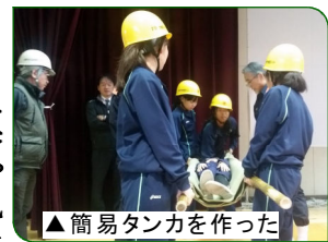
▲簡易タンカを作った

とても有意義な防災訓練となり、それぞれの意識も高まったと思います。今後も地域と共に防災や減災について、何ができるのかを考えていきたいと思っています。