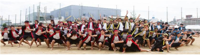
全員でフィニッシュ！ かっこいいですね。