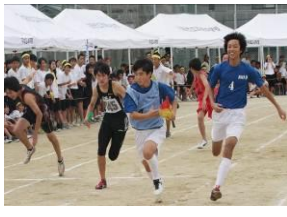
部活動対抗リレー