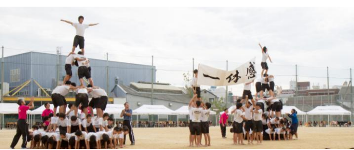
これぞ一体感！5段塔完成。