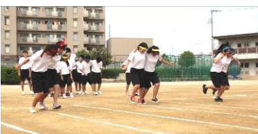
息を合わせて2人3脚