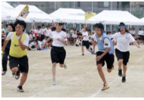
アンカーにバトンタッチ