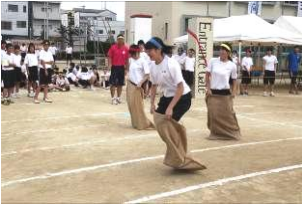
ジャンプ、ジャンプ！