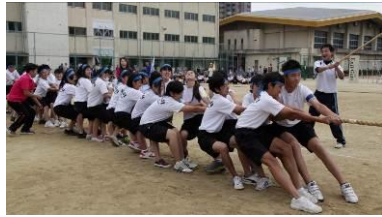
先生も気合いが入ってます