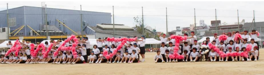
ボン文字が完成。 やったね！