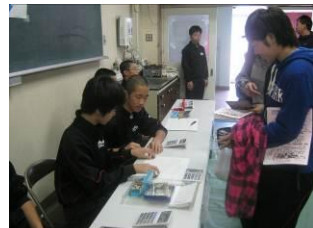
会計はたいへんでした