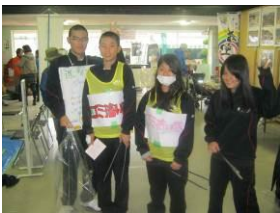
カーニバルのお手伝い