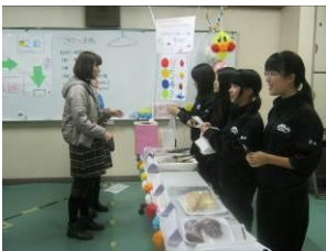
2-1 進撃のジャムおじ

舞台発表の部では吹奏楽部がオープニングを飾る素晴らしい演奏を披露し、サークル活動でも、障間研がぜんざいを販売して完売しました。また、生徒会は西淡路・淡路両小学校の児童会のメンバーと共に「遅刻ゼロ」を目指しての「3校合同あいさつ運動」の取組みについてアピールを行いました。