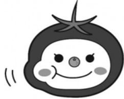
大阪市食育推進キャラクター 「たべやん」

みなさんは、1回の食事でどのくらいかんでいますか？ よくかんで食べると、食欲を抑えるホルモンの分泌 おさぶんびつ が高まり、食べ過ぎ ふせ を防ぐことができます。また、ゆっくり味わうことで、薄味 うすあじ かつ適量で満足感が得られます。