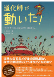
『道化師が動いた!』 (生産性出版)