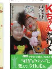
『ホスピタルクラウン・Kちゃんが行く』 (佼成出版社)

第57回 青少年読書感想文 全国コンクール課題図書 小学校中学年(3、4年生)の部