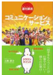
『道化師がコミュニケーションとサービス』 (生産性出版)