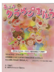
『えにっき クラウンのまほう』 (生産性出版)