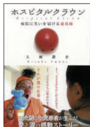
『ホスピタルクラウン』 (サンクチュアリ出版)