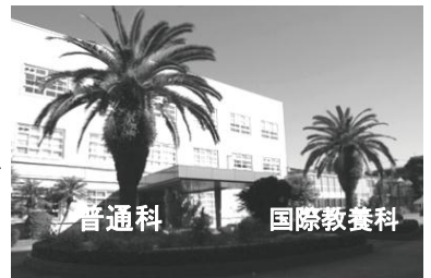
旭高校を象徴する 2本のフェニックス

A2. 文系、理系に対応できる普通科と国際的な視野を養う国際教養科 、両科の特長を生かしながら、基本的事項はもとより応用発展的事項にいたるまで行き届く授業と、グループワークなどの参加型学習や最新の機器（CALL、LAN、ICTなど）を利用した授業を展開しています。また常時2名のネイティブの英語教員がいる国際教養科の利点を生かし、普通科の英語学習環境も充実しています。