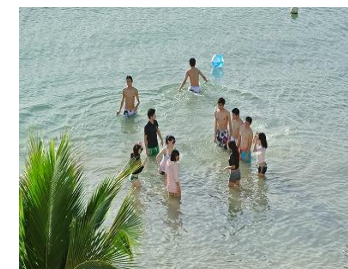
修学旅行（25～27年度 グアム島） 28年度は石垣島