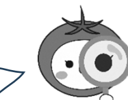
大阪市食育推進キャラクター「たべやん」