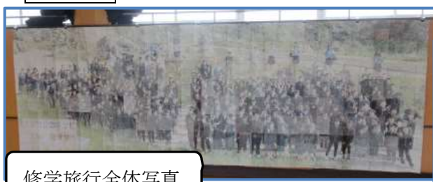
修学旅行全体写真