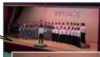
音楽コンクールの様子

みんなで気持ちを一つにし、それぞれの想いを込めて創造した歌のメッセージ。混声三部合唱の難しさ。男女の掛け合いのタイミングと声量の大きさ。言葉で想いを伝える難しさや男女のバランス良く澄んだ歌声、ハーモニーの美しさなど、練習すればするほど深みが出る合唱。限りなく美しく、心に響く歌声を創り出そうと懸命に努力した結果が表れていました。