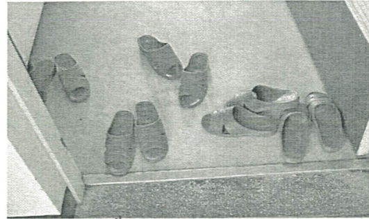
バラバラです C館男子トイレ