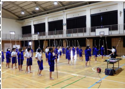
↑授業の様子。(3・4組女子)

ま校ない真ぎトし作り講業「 しきたま剣なルまやし師がな女 さんしにたをし心てのあぎ子 にはた取「超た構、先りなの お、りをええ武生また体 借汎一組使う二を道をし「育 り愛なんい「メ学のおたので し高ぎで、な「習所招授