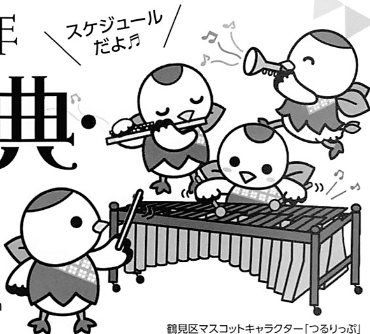
鶴見区マスコットキャラクター「つるりっぷ」

A 40th anniversary of Tsurumi Ward system Memorial Ceremony & Music Festival