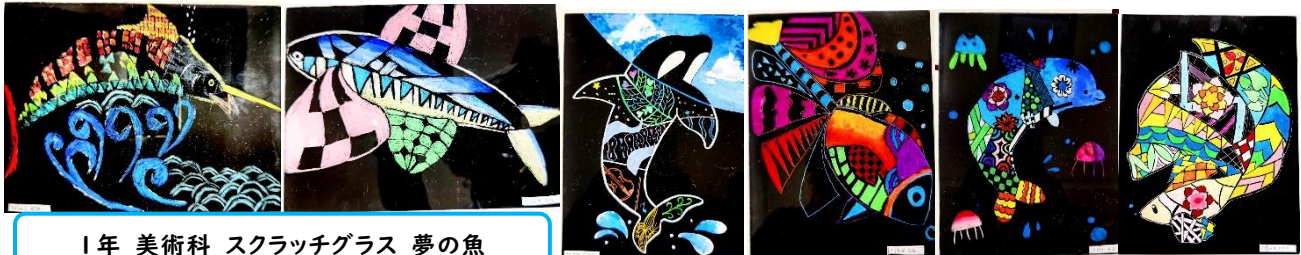
1年 美術科 スクラッチグラス 夢の魚