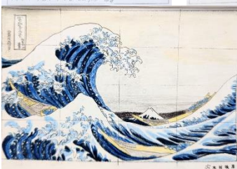
2年 美術科 名画 模写