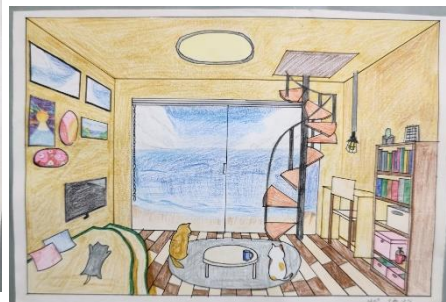
2年 美術科 『マイルーム』