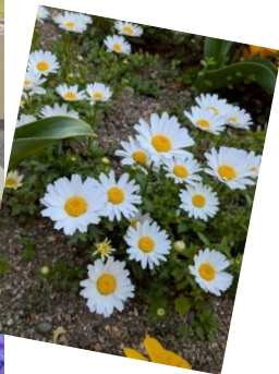
正門横の花壇です