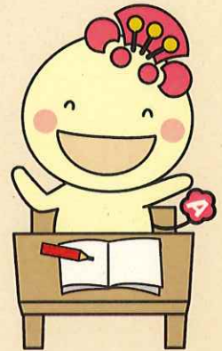
阿倍野区マスコットキャラクター あべのん