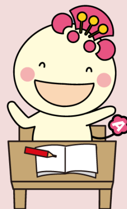
阿倍野区マスコットキャラクター あべのん

また、市民の皆様には教科書への関心を持っていただくとともに、教科書について広く意見を集めることを目的として、アンケートを実施します。皆様のご意見・ご協力をよろしくお願いします。