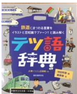
テツ語辞典 誠文堂新光社