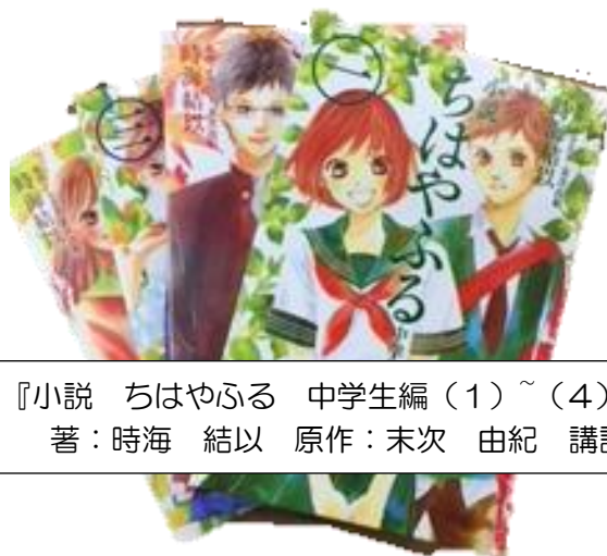
『小説 ちはやふる 中学生編（1）～（4）』 著：時海 結以 原作：末次 由紀 講談社