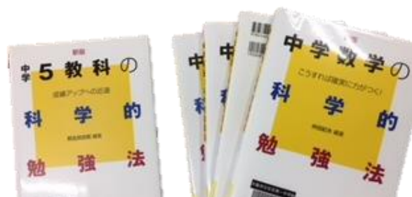
中学生の勉強法シリーズ 全 5 巻 評論社