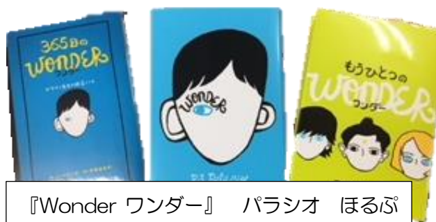
『Wonder ワンダー』 パラシオ ほるぷ