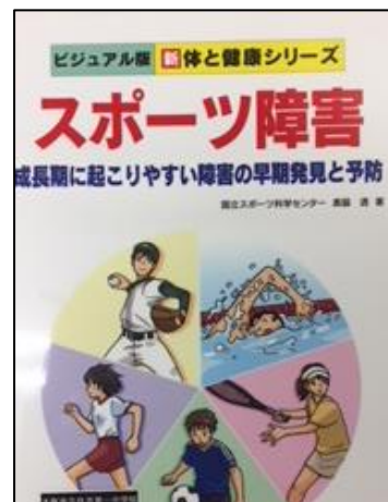
スポーツ障害 奥脇透 少年新聞社