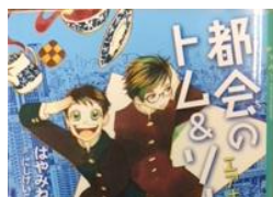
『都会のトム&ソーヤ(15)』 エアポケット はやみねかおる 講談社