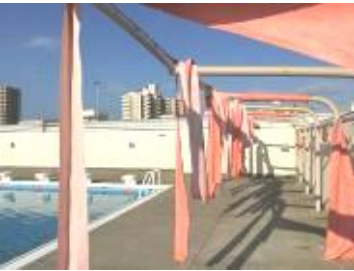
昨年度の台風21号によりプールのテントに被害

昨年、9月4日に大阪を直撃した台風21号から約1年経ちました。これでもかといくらしいの猛威を直に感じました。そして、今年9月9日に関東地方に上陸をした台風15号は猛威をふるって、各地に傷跡を残しました。特に千葉県では、強風により送電網が破壊され、大規模な停電や断水が長期間続き、大被害をもたらしました。昔から9月1日を二百十日と呼ばれ人々に警鐘を鳴らしています。今後も、台風や大雨などの自然災害に襲われる可能性があります。日頃の予防が大切です。10月5日（土）に土曜授業として、防災学習を学ぶ学年があります。しっかりと学んで今後に役立ててほしいと思います。普段から防災グッズを準備するとともに、家族で非常時の行動の確認をしておきましょう。