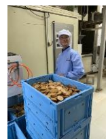
松岡製菓 スギ薬局