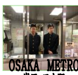
OSAKA METRO 岸里・玉出駅

(松岡製菓でのまとめ一要点) ーさん ○体験した内容ー シールをはる、箱につめる、ラッピングする、箱を2階から1階におろす(すべり台)、味つけ・焼き・粉はこび、失敗した製品を集めるなど ○学んだことー 自分の手に届く商品はすべてキレイで整っているものばかりだけど、それまでにはいろいろなハプニングや、やりなおしなどいろいろなことがあってとどく、とても大切なものだと思んだ。社会で働くと言うことは、責任を持って働くと言うことだと実感した。