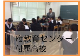
府教育センター 付属高校