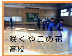
咲くやこの花高校

ました。西高校は「Do you want some popcorn?」で英語の授業を受けました。咲