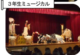
3 年生ミュージカル