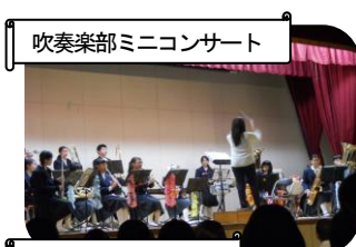
吹奏楽部ミニコンサート

鑑賞態度もよく、素晴らしい文化発表会でした。友だちの今まで知らなかった才能を発見することもあったかもしれませんね。北中の全員が、それぞれのポジションでしっかり頑張ってくれました。(拍手!) この経験をこれからの学校生活に活かしてください。