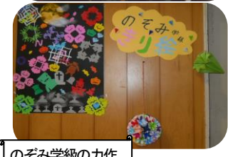
のぞみ学級の力作