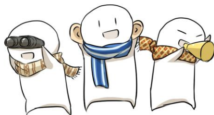
見て 聞いて 話して

さて、今年は申年。「見ざる、聞かざる、言わざる」の三猿が有名ですが、ひとの過ちや欠点・余計なことを見聞きしなかったこととするのが良い、という意味のこの言葉は、日本だけでなく、中国・インド・アメリカ・古くは古代エジプトなど世界中でよく似たものが使われているようです。つい人の過ちや欠点に目が行き、噂をしてトラブルになるなんていうのは古今東西ありがちなかもしれません。これを機会に、言動を見直してみるのもいいでしょう。しかし、必要なことはしっかり「見て、聞いて、話して」ということも大切ですよね。